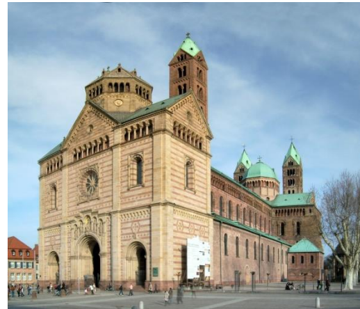
Dom in Speyer